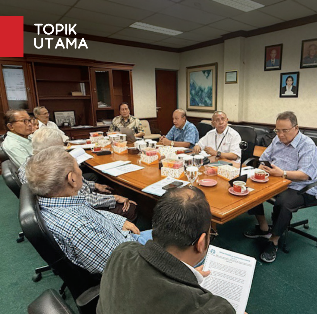
Pengurus mempresentasikan RKAB 2026