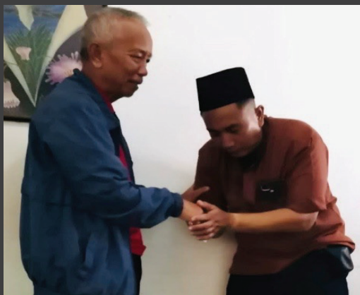
Ketua HA-C Geomin menyerahkan bantuan uang duka