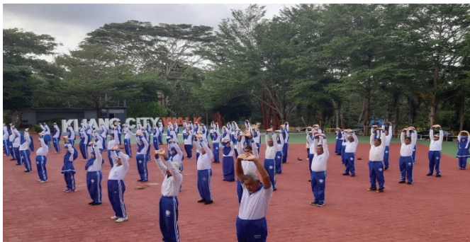
Senam Ling Tien Kung

Selain senam jantung sehat, pensiunan yang merupakan anggota HA-C Kijang juga ikut bergabung dengan masyarakat Kota Kijang untuk melaksanakan kegiatan senam terapi Ling Tien Kung , suatu olah raga untuk mengolah napas. HA-C Kijang sangat aktif mengajak anggotanya untuk melakukan senam dengan memanfaatkan momen yang ada demi menjaga kebugaran para pensiunan anggotanya.