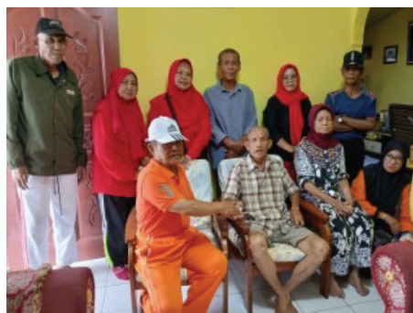
Kunjungan ke Bapak Muadil