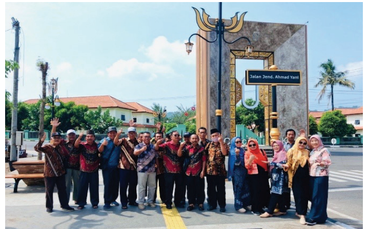
Berfoto di Tugu KM-0

Sementara itu Ranting Adipala mengawali awal tahun 2026 dengan melakukan kegiatan Family Gathering (FG) bertempat di Pantai Jetis pada tanggal 4 Januari 2026. FG tersebut diisi dengan kegiatan permainan game untuk meningkatkan kerjasama, meningkatkan daya ingat dan kekompakan. Ada juga ceramah motivasi yang berisi kiat-kiat hidup sehat dan harmoni dalam rumah tangga di usia lanjut. FG ini diramaikan juga dengan pembagian hadiah, makan bersama sambil rekreasi.