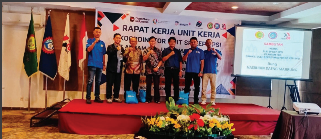
Raker SPSI Antam Buli di Manado