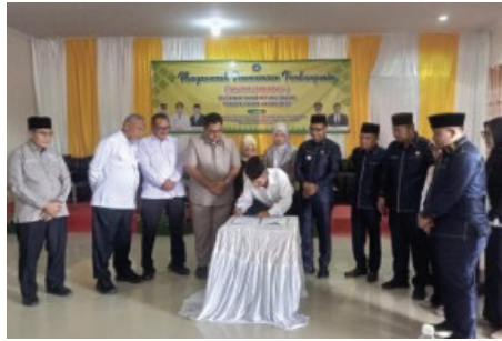
Penandatanganan Kesepakatan Musrenbang