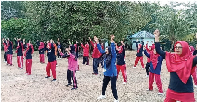
Suasana Senam Jantung Sehat

Acara ini juga dibarengi dengan ceramah kesehatan yang mengambil topik : pentingnya menjaga kesehatan dalam menjalankan ibadah puasa pada bulan Ramadhan 1447H yang akan datang , dengan presenter dr. Rara. Acara-acara seperti ini sangat diminati para pensiunan sehingga tingkat partisipasi mereka cukup tinggi.