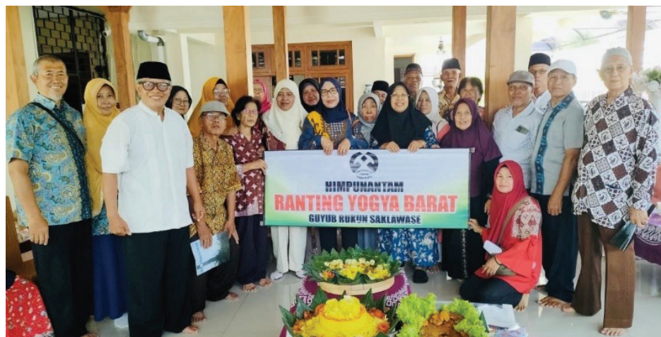
Suasana Arisan di Ranting Barat