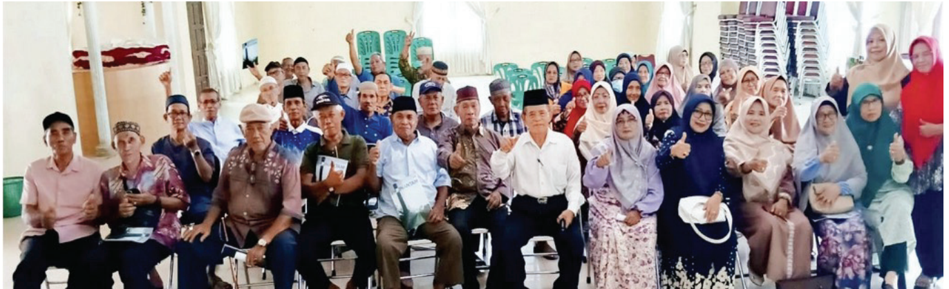
Foto Bersama di akhir arisan

Acara ini diisi dengan sholawatan dan dzikir bersama, tauziah dan diakhiri dengan pembagian bingkisan dan buletin Purnantam.