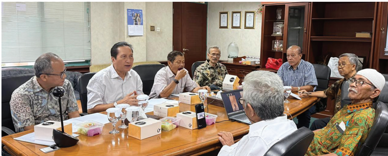
Mendengar arahan dari Pembina

Untuk melaksanakan rencana kerja tersebut, Pengurus mengajukan biaya sebesar Rp.257.400.000.-, yang akan dialokasikan untuk kegiatan : 1) Kesekretariatan sebesar Rp.81.000.000.-, 2) Kebendaharaan sebesar Rp.28.000.000.-, 3) Bidang Organisasi & Usaha sebesar Rp.33.400.000.-, dan Bidang Sosial & Kesejahteraan sebesar Rp.115.000.000.-