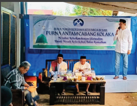
Pembina memberikan sambutan