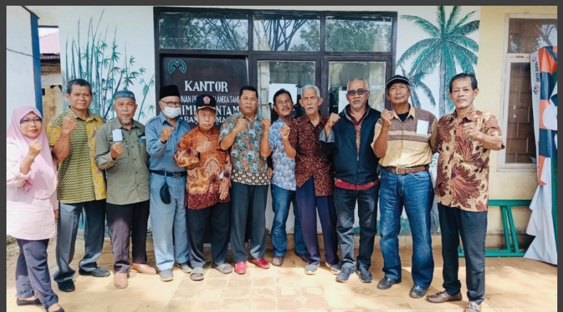
Foto Bersama Pengurus HA-C Kolaka Yang Baru