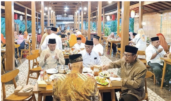
Suasana saat berbuka puasa