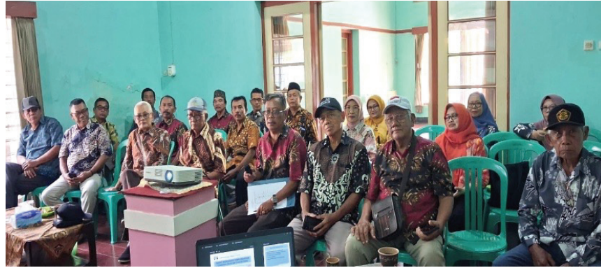
Suasana Rapat Kordinasi

Rapat tersebut dimulai dengan jalan kaki oleh semua peserta, dimulai dari kantor Himpunantam Cilacap menuju kota lama di titik nol. Dalam rapat tersebut, masing-masing ranting melaporkan kegiatan yang dilakukan pada tahun 2025, antara lain meliputi kegiatan : penyelenggaraan pertemuan rutin, kunjungan kepada anggota yang sakit atau berduka, pemberian bantuan dana sosial dan uang duka, penyelenggaraan rekreasi untuk menguatkan persaudaraan, dan kegiatan sosialisasi kesehatan.