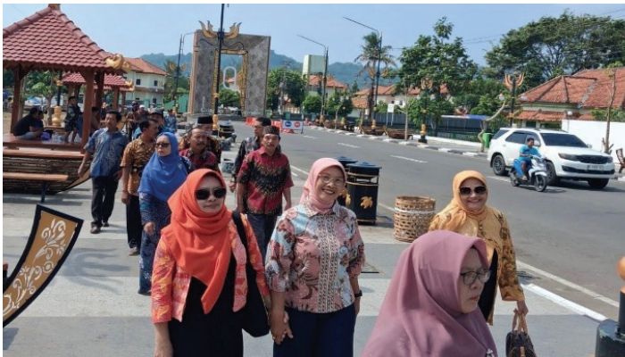
Peserta berjalan kaki menuju KM-0

Pada kesempatan itu juga disampaikan mengenai kendala-kendala yang dihadapi dalam pelaksanaan kegiatan, untuk dicarikan jalan keluarnya, sehingga kegiatan-kegiatan berikutnya bisa berjalan dengan lancar. Mengingat bulan Pebruari sudah akan memasuki bulan puasa, maka dalam rapat ini juga dibicarakan persiapan penyelenggaraan halal bi halal yang rencananya akan dilaksanakan di bulan April 2026.