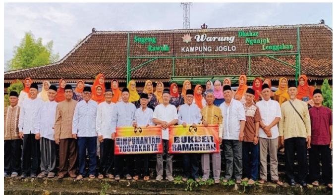
Foto bersama setelah bukber

Sementara itu, pada tanggal 27 Februari 2026, bertempat di Resto Ndalem Sekar Suli, HA-C Yogyakarta mengadakan acara buka puasa bersama yang dihadiri sekitar 70-pensiunan. Pada acara tersebut dibagikan souvenir dari salah seorang anggota yang ingin bersedekah di bulan suci ramadhan ini.