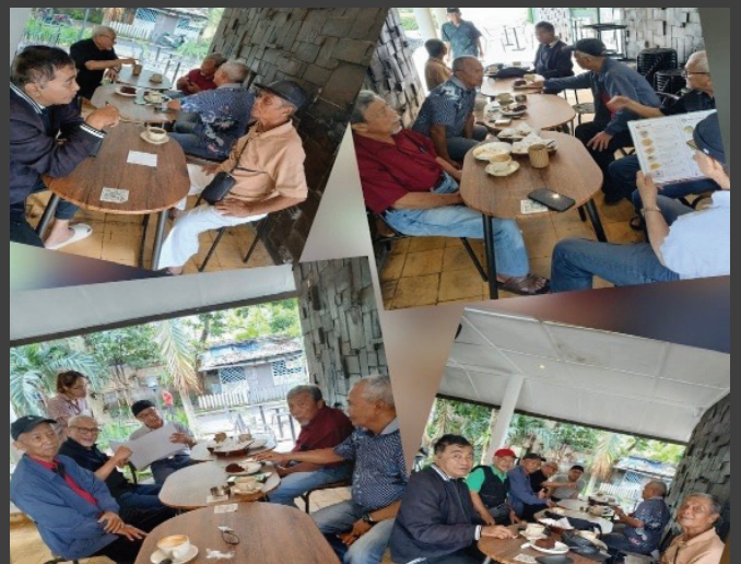
Suasana Ngopi Bareng