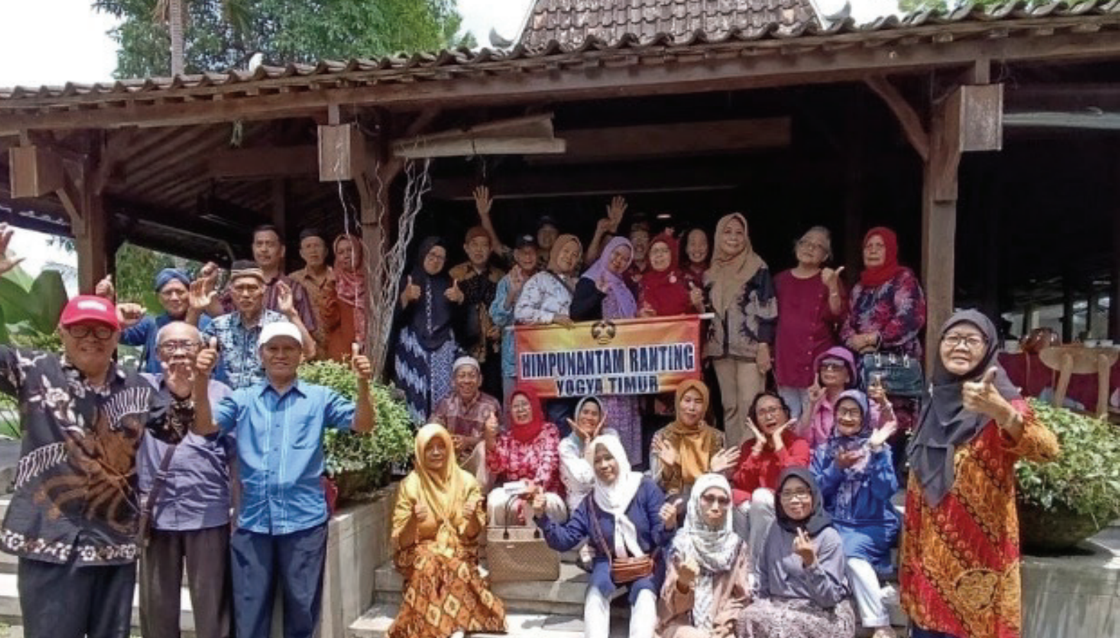
Foto bersama di akhir arisan