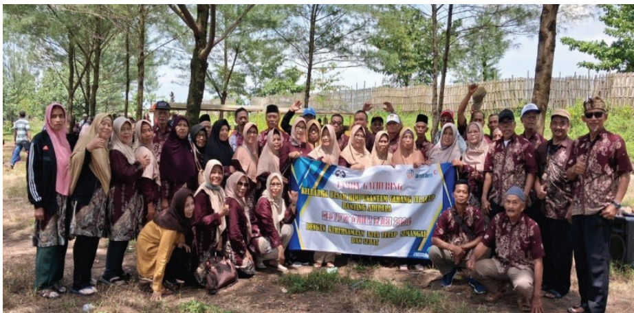
FG Ranting Adipala

Sementara itu Ranting Adipala mengawali awal tahun 2026 dengan melakukan kegiatan Family Gathering (FG) bertempat di Pantai Jetis pada tanggal 4 Januari 2026. FG tersebut diisi dengan kegiatan permainan game untuk meningkatkan kerjasama, meningkatkan daya ingat dan kekompakan. Ada juga ceramah motivasi yang berisi kiat-kiat hidup sehat dan harmoni dalam rumah tangga di usia lanjut. FG ini diramaikan juga dengan pembagian hadiah, makan bersama sambil rekreasi.